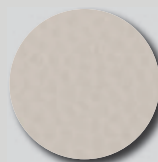
Hamlet RAL 9002