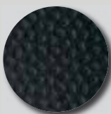
Anthracite RAL 7016