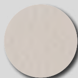
Hamlet RAL 9002