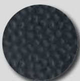
Anthracite RAL 7016