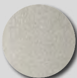
Grey Aluminium RAL 9007