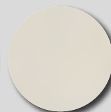
Hamlet RAL 9002