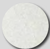
Silver metallic RAL 9006

Quelques exemples de couleurs de Colorcoat Prisma®