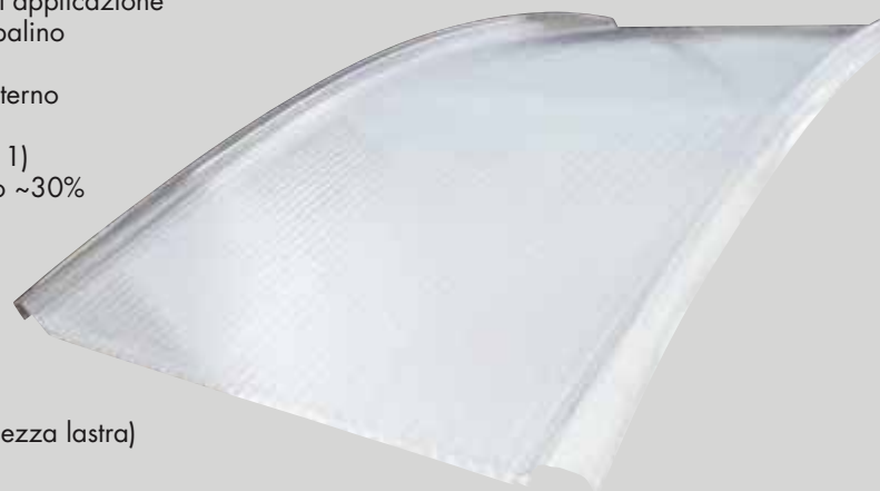
Lastra curva R~3300/6000