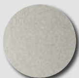
Grey Aluminium RAL 9007