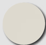
Hamlet RAL 9002