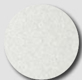
Silver metallic RAL 9006

Alcuni esempi di colori di Colorcoat Prisma ®