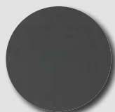
Anthracite RAL 7016